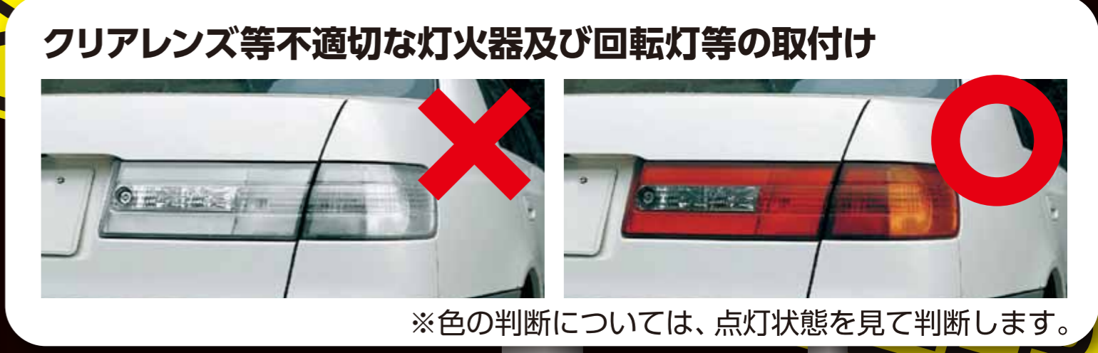
クリアレンズ等不適切な灯火器及び回転灯等の取付け