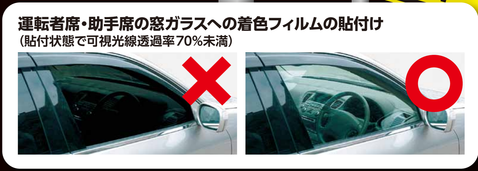
運転者席・助手席の窓ガラスへの着色フィルムの貼付け (貼付状態で可視光線透過率70%未満)